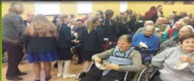
Kalėdiniai sveikinimai globos namų gyventojams