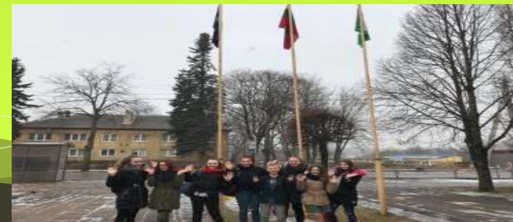
Vėliavos pakelimas žemės dienai