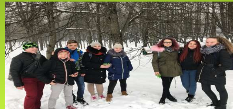
Įšvyka į parką - pagalba paukšteliams