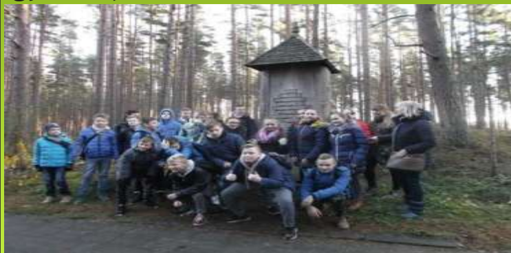
M. Daujoto vardadienio paminėjimas Palangoje