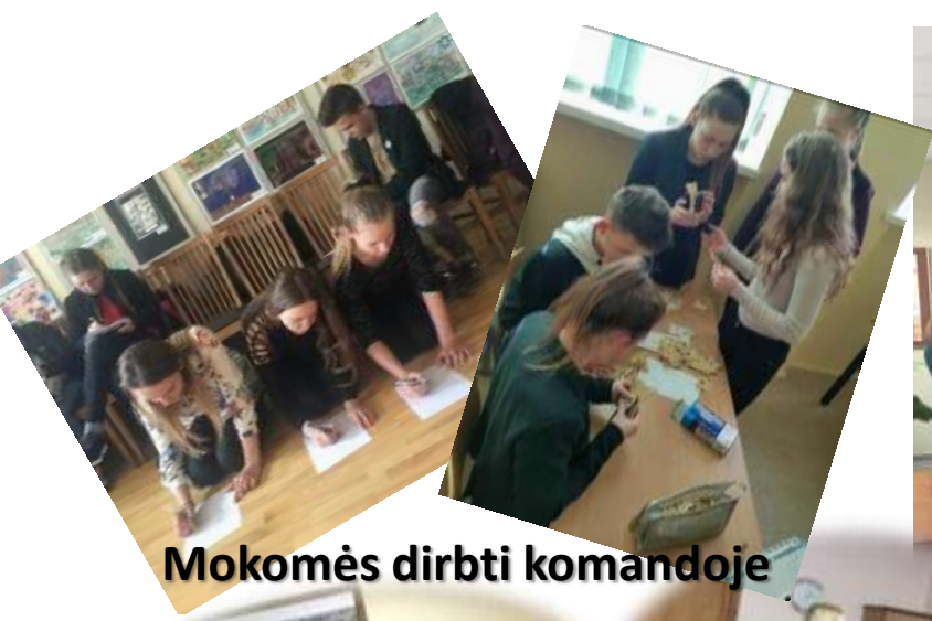
Mokomės dirbti komandoje