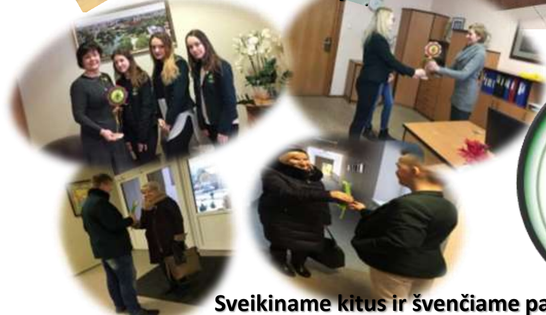
Sveikiname kitus ir švenčiame patys