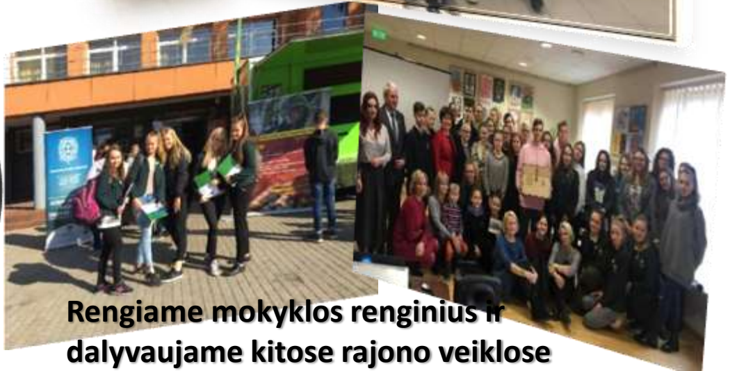
Rengiame mokyklos renginius ir dalyvaujame kitose rajono veiklose