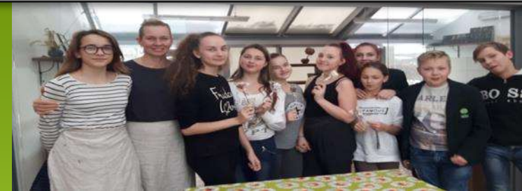
Kalėdų stebuklo belaukiant Žiemos sode...

Pagrindinė būrelio veikla yra tradiciniai mokyklos renginiai, ekologinės – pažintinės išvykos, kūrybiniai užsiėmimai, ekologinės akcijos, projektai. Mokiniai mokomi pažinti, saugoti ir globoti augaliją bei gyvūniją, ugdytis ekologinę kultūrą, tirti bei analizuoti gamtoje vykstančius reiškinius