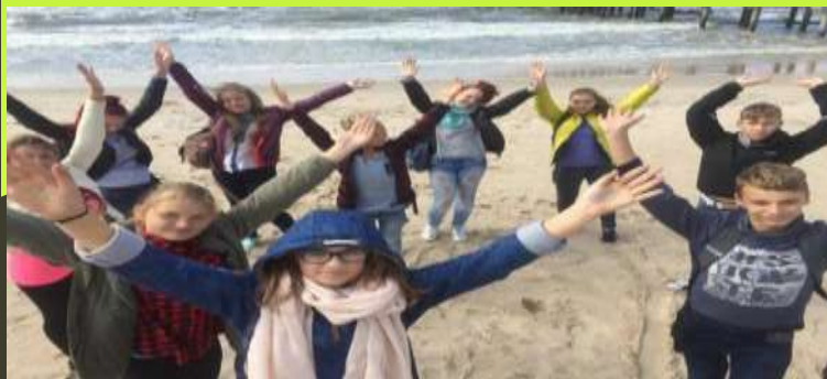
Akcija „Baltijos apkabinimas

„Jaunieji daujotukai” Vadovė – geografijos mokytoja