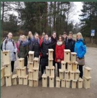
Pasaulinė miškų diena

„Jaunieji daujotukai“ - vadovė- geografijos mokytoja