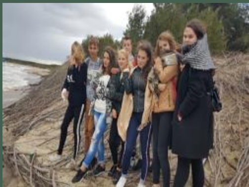
Akcija „Baltijos apsikabinimas“