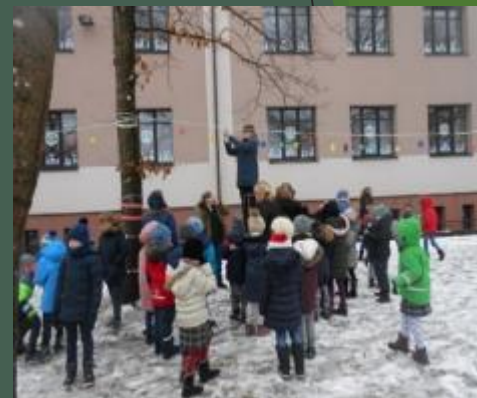
Ekologinis projektas „ Medžio ir žmogaus draugystė“

Pagrindinė būrelio veikla yra tradiciniai mokyklos renginiai, ekologinės – pažintinės išvykos, kūrybiniai užsiėmimai, ekologinės akcijos, projektai. Mokiniai mokomi pažinti, saugoti ir globoti augaliją bei gyvūniją, ugdyti ekologinę kultūrą, tirti bei analizuoti gamtoje vykstančius reiškinius