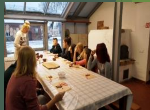
Kalėdų stebuklo belaukiant Žiemos sode...